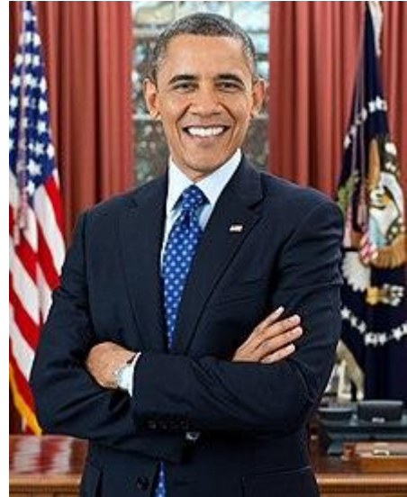
Official portrait, 2012

Tradisionele idees uitdaag: Barack Obama het tradisionele idees van manlikheid uitgedaag deur openlik empatie, kwesbaarheid en emosionele intelligensie tydens sy presidentskap te toon. Hy het krag getoon deur sy leierskap, terwyl hy ook deernis, inklusiwiteit en die belangrikheid van familie waardeer.